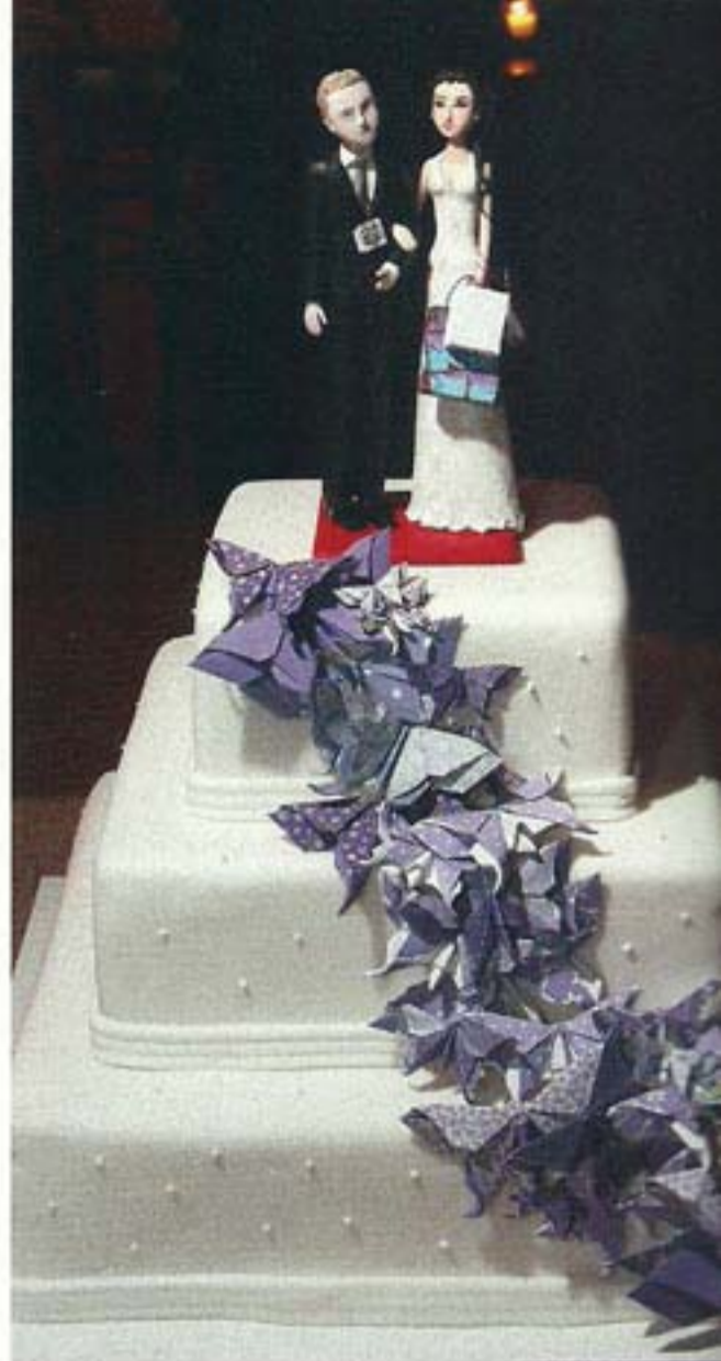
Em pasta americana branca com poás, o bolo de três andares trazia borboletas em tons de lilás, cor que, de acordo com a noiva, é sinal de transformação e energia.