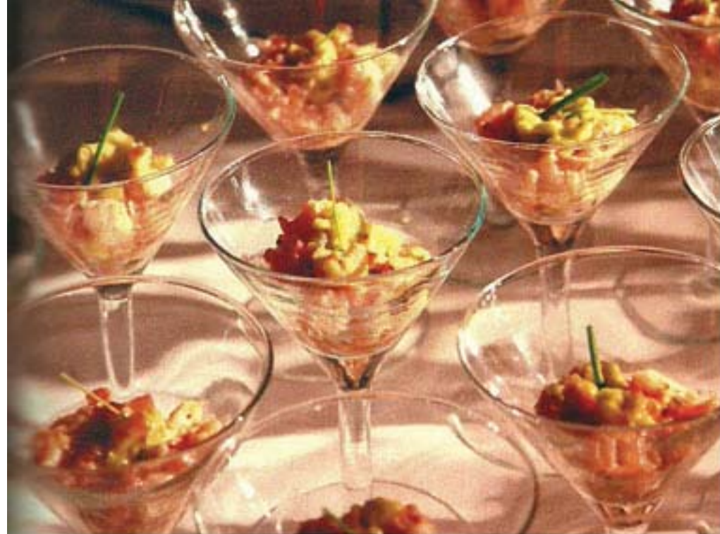
Os 470 convidados desfrutaram das saborosas tacinhas com rillette de salmão, camarões e guacamole.