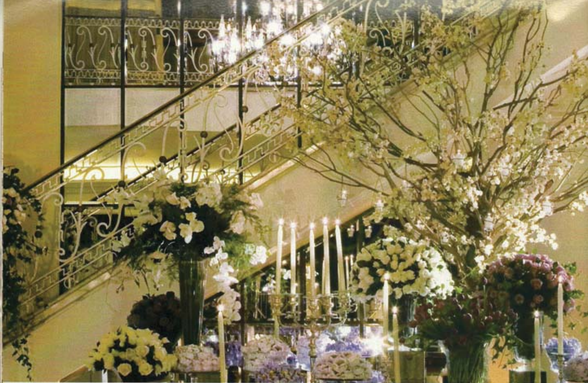
Orquídeas, rosas e delicadas árvores francesas iluminadas com velas trouxeram requinte e romance ao ambiente. Por Rubens Decorações